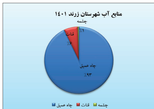
« شکل (۲): منابع آب شهرستان زرنند ۱۴۰۱

پدیده‌های زیستی در دوران کنونی است و توسعه پایدار جوامع وابسته به استفاده بهینه از این نعمت حیاتی و کلیدی است بنابراین مدیریت مصرف آن در بخش‌های مختلف و استفاده در بخش‌هایی با ارزش افزوده بیشتر و بهره‌وری بالاتر ضروری به نظر می‌رسد.