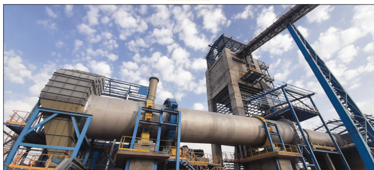
« مجتمع کنسانتره و گندله سازی، کارخانه درایر «

با اسکن کدهای QR نشریه ویدئوهای مرتبط را ببینید.