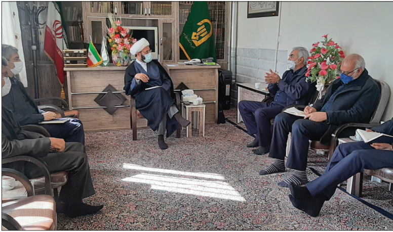
« دیدار مدیرعامل با امام جمعه زرند »