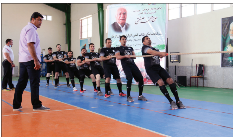
« شرکت در مسابقات طناب‌کشی »