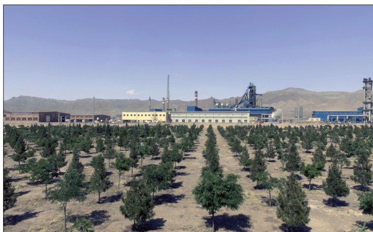
« مجتمع فولاد سازی زرند ایرانیان