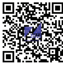
« بخش اول »

با اسکن کدهای QR نشریه، ویدئوهای مرتبط را ببینید.