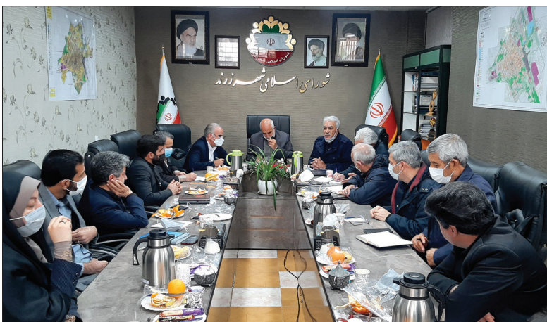
« دیدار مدیرعامل با اعضای شورای اسلامی شهر زرند »