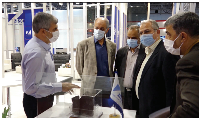
« حضور زیسکو در سیزدهمین نمایشگاه بین‌المللی متالورژی و فولاد - اصفهان »