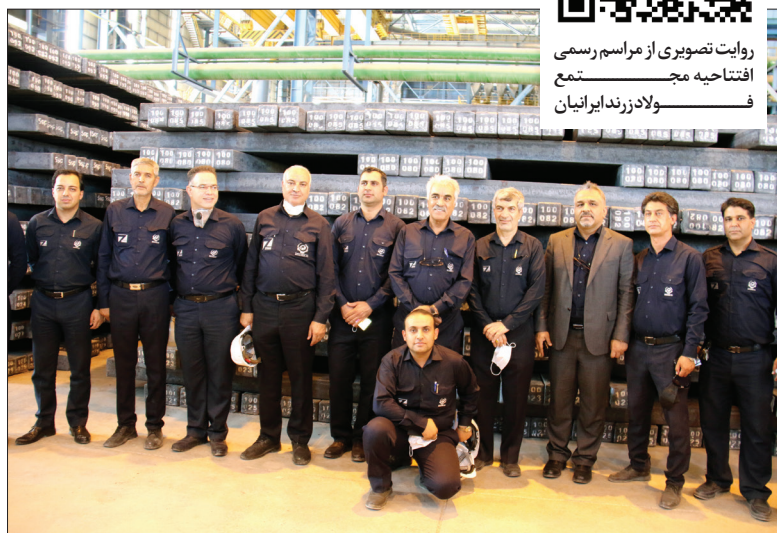
روایت تصویری از مراسم رسمی افتتاحیه مجتمع فولاد زرنند ایرانیان