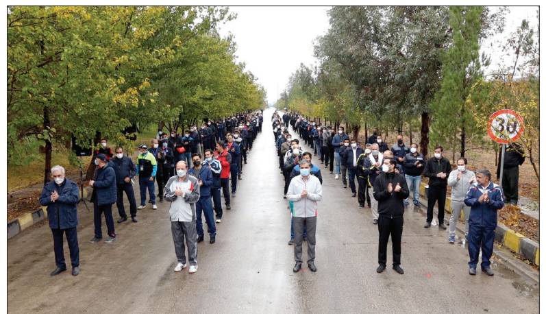
« پویش ورزش صبحگاهی »