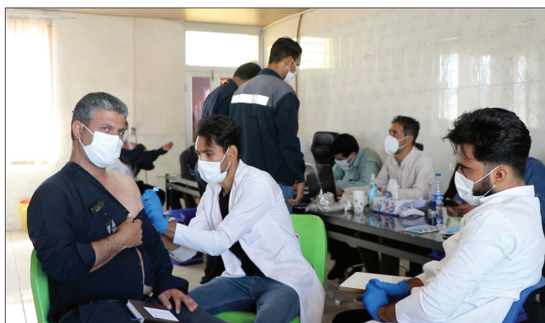
« واکسیناسیون کارکنان »