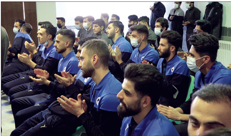
« دیدار و گفت‌وگوی مدیرعامل با اعضا و کادر فنی تیم‌های فوتسال امید و بزرگسال زیسکو »