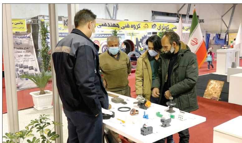
« حضور زیسکو در دومین نمایشگاه نهضت تولید، بومی‌سازی و صادرات - کرمان »