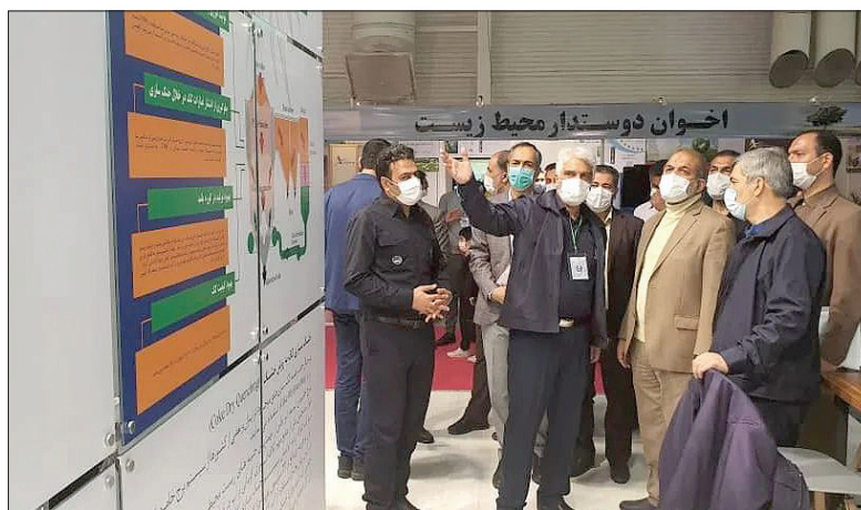
« حضور زیسکو در نوزدهمین نمایشگاه بین‌المللی محیط زیست - تهران »