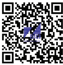
« بخش دوم »