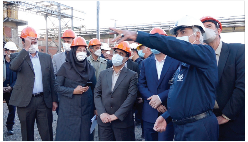
« بازدید معاون رییس جمهور از کارخانه سی دی کیو »