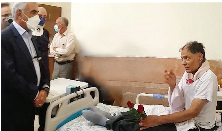
« دیدار مدیرعامل با جانبازان »